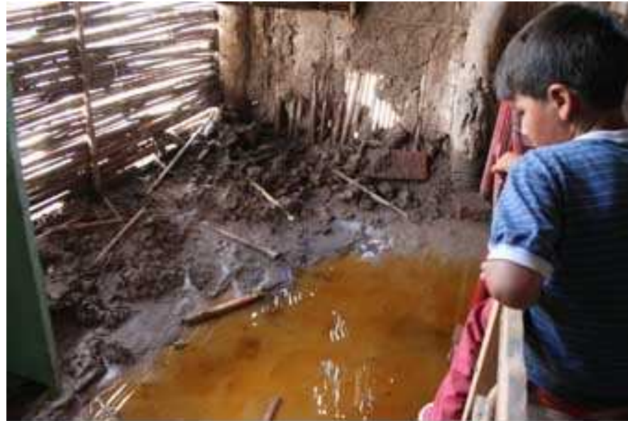
Familia evacuada en Cochagua